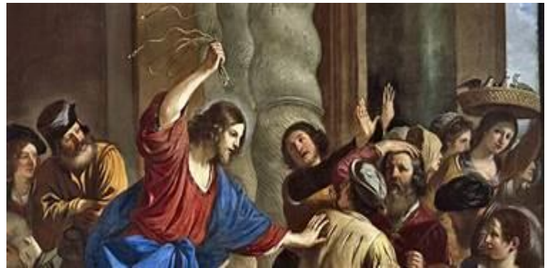
Jezusi dëbon tregtarët nga tempulli

Jezusi duke dëbuar tregtarët nga tempulli, shpall fundin e ligjit, të tempullit dhe të flisë. Pas ringjalljes së tij paraqet vetveten, trupin e tij të lavdishëm si tempulli i vërtetë i Hyjit. Ringjallja do ta bëje trupin e tij banesën e Shpirtit Shenjt. Jezusi vetë do të jetë prania e Hyjit për të gjithë gjithmonë dhe kudo.